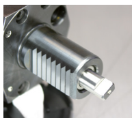
Homlokhajtású tengely pl. Duplomatic, DIN 1809