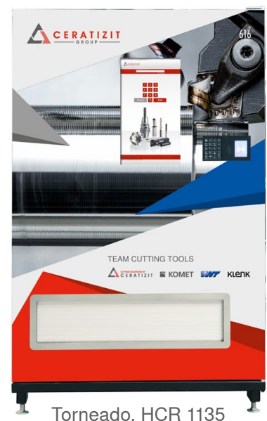
Torneado, HCR 1135