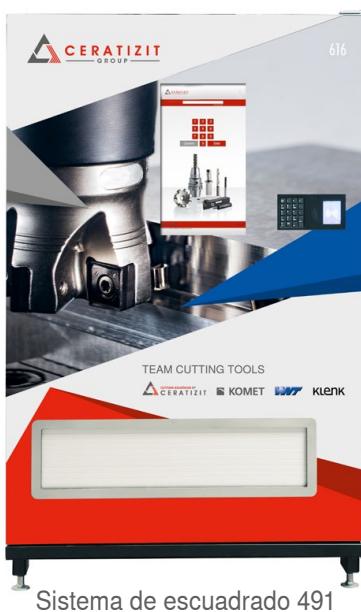
Sistema de escuadrado 491