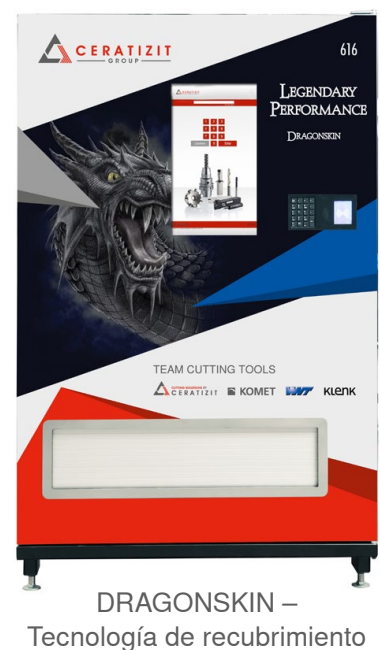
DRAGONSKIN – Tecnología de recubrimiento