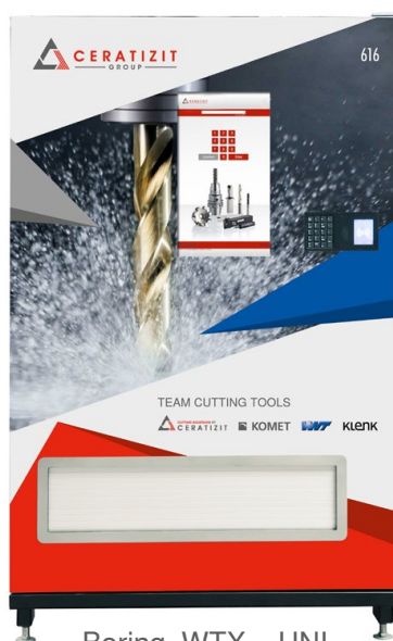
Boring, WTX – UNI

Vælg dine favoritter blandt vores fem førsteklases design til TOOL-O-MAT 840: