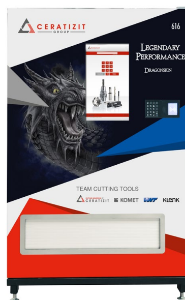
DRAGONSKIN – Belægningsteknologi