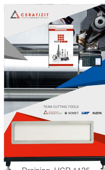
Drejning, HCR 1135