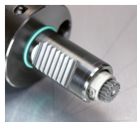
Zagozdna gred (npr.: Sauter, DIN 5480/5482)