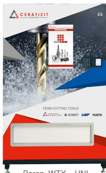
Boren, WTX – UNI

Kies uw favoriet uit onze vijf top-designs voor de Tool-O-Mat 840