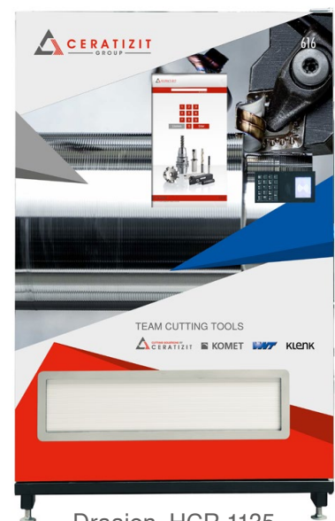
Draaien, HCR 1135