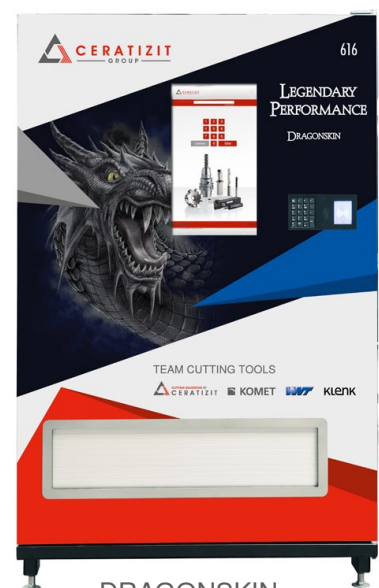
DRAGONSKIN - Coatingtechnologie